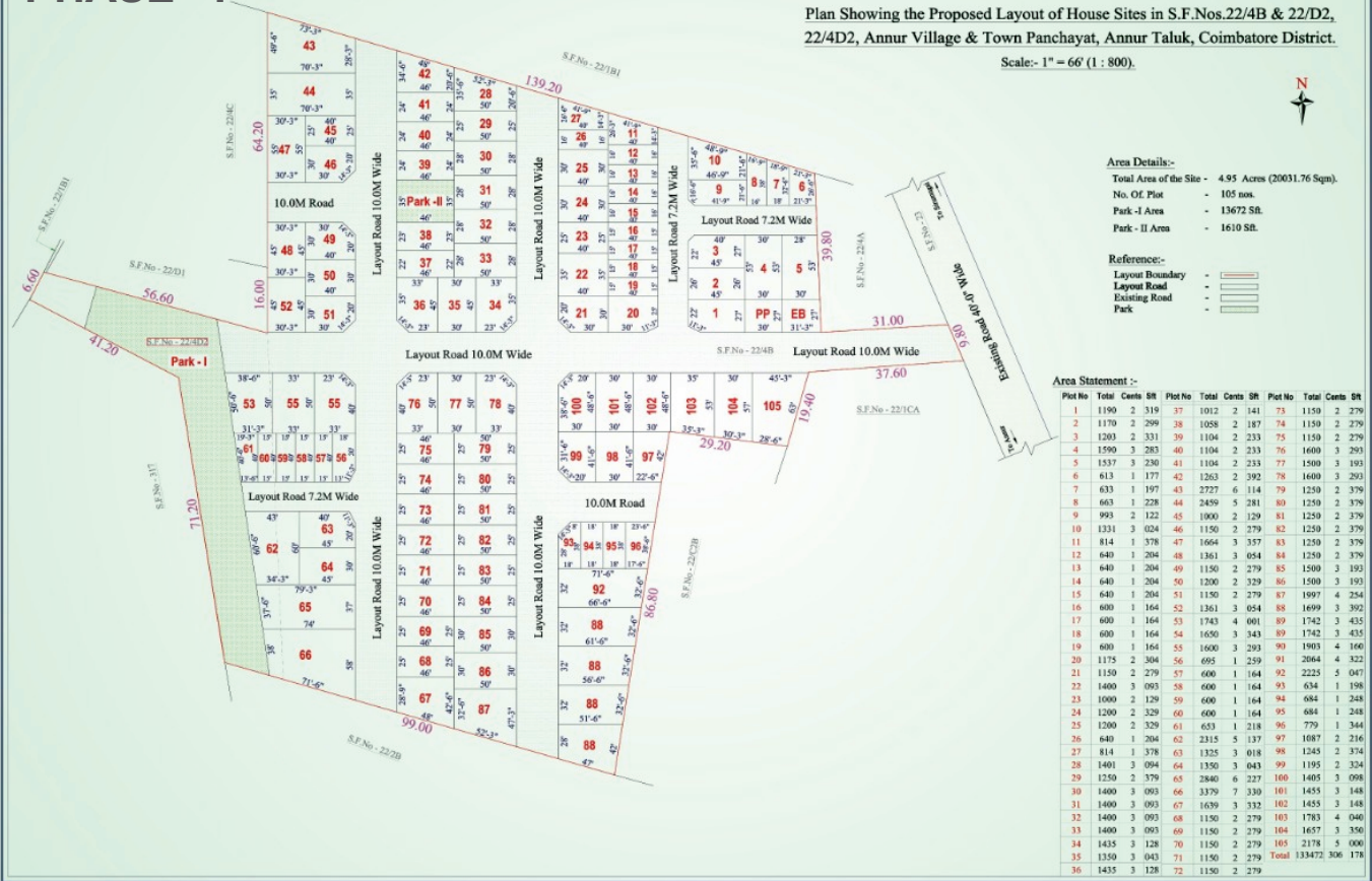
Plan Showing the Proposed Layout of House Sites in S.F.Nos.22/4B & 22/D2, 22/4D2, Annur Village & Town Panchayat, Annur Taluk, Coimbatore District. Scale:- 1" = 66' (1 : 800).